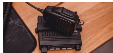
Keine chinesische Technik verbaut: deutsche Funkgeräte (Symbolbild).

Zudem teilt die Bundesregierung auf die Frage, wann eine finale Entscheidung hinsichtlich chinesischer Komponenten im deutschen Mobilfunknetz getroffen wird, mit, dass das durch das Bundesministerium des Innern und für Heimat (BMI) geführte Verfahren nach Paragraph 9b Absatz 4 des Gesetzes über das Bundesamt für Sicherheit in der Informationstechnik (BSIG) noch nicht abgeschlossen sei. Dieser Paragraph regelt die Untersagung des Einsatzes von kritischen Komponenten.