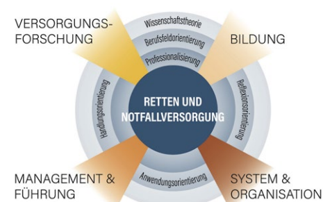
Modell der Rettungswissenschaften nach Prescher et al. (2023)

Aktuell wird diese Disziplin sowohl als Rettungswissenschaft (Singular) wie auch als Rettungswissenschaften (Plural) bezeichnet. Die Unterschiede darin sind eher