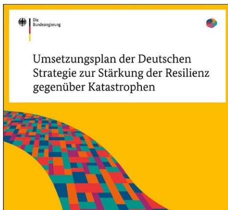
Zwei Jahre nach Verabschiedung der Strategie kommt ein Umsetzungsplan.

Die fünf Handlungsfelder der Strategie sind „Das Katastrophenrisiko verstehen“,